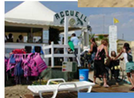
« Concession Bounty Plage au Cap d'Agde » (Proposant des services à la personne)