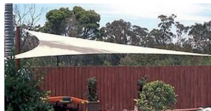
Une toile design

Rai-Tillières (prix HT, hors livraison, hors frais d'installation...)